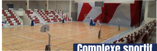
Complexe sportif La Doller