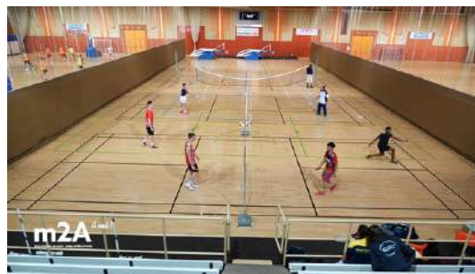
Centre sportif : musculation, gymnase & internat