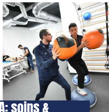
IMSSA: soins & récupérations