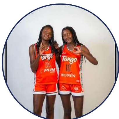
Anna MANE Amycolet MANE