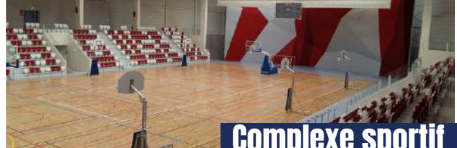
Complexe sportif La Doller