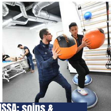
IMSSA: soins & récupérations