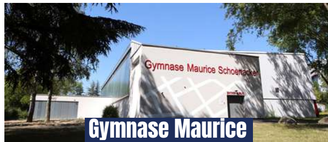
Gymnase Maurice Schoenacker